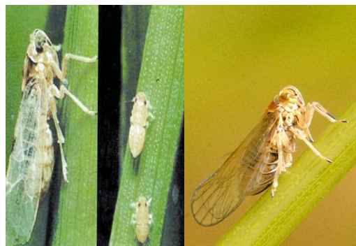
پوره و حشرات بالغ زنجریک